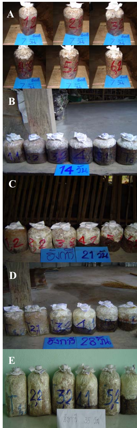
Figure1 Period of time the growth of strings of Hungarian Oyster Mushroom in breeding material proportion of cassava cover and softwood sawdust to observe form to expand of strings which in figure will appearance color white to begin top up of bag (the growth of strings of Hungarian Oyster Mushroom A = 7 days B = 14 days C = 21 days D = 28 days E = 35 days )